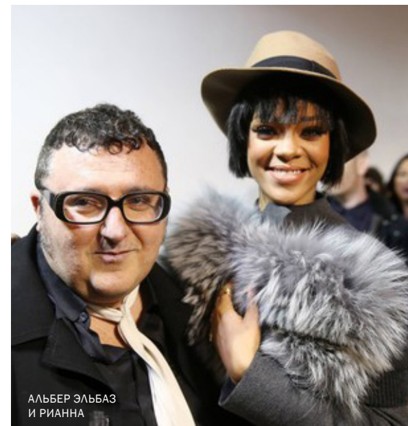
АЛЬБЕР ЭЛЬБАЗ И РИАННА