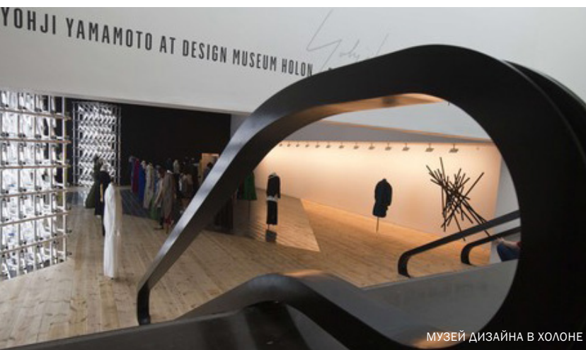
МУЗЕЙ ДИЗАЙНА В ХОЛОНЕ